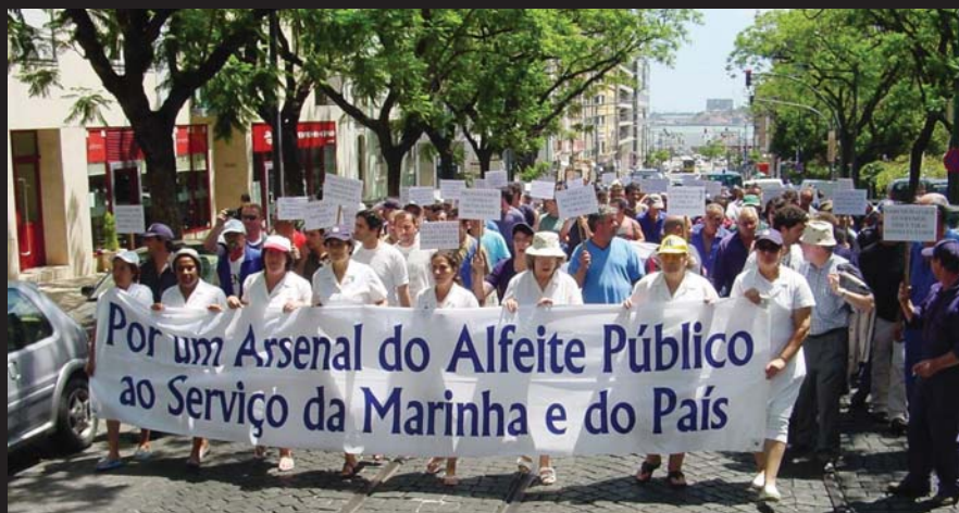
Manifestação na residência Primeiro Ministro, Julho 2007, CG