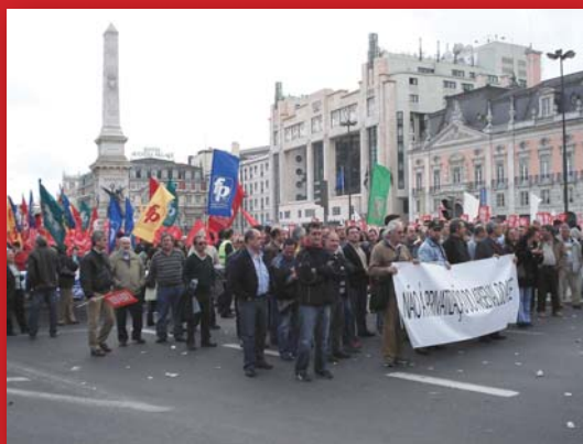
Manifestação em Lisboa CGTP, Março 2007 CG

Cabe aos arsenalistas de hoje defender um património de saber, de luta e de resistência acumulado ao longo de gerações, enriquecido com os direitos conquistados no 25 de Abril, de modo a não permitir que interesses privados se sobreponham aos interesses económicos do País, da Marinha, do Arsenal e dos seus trabalhadores.