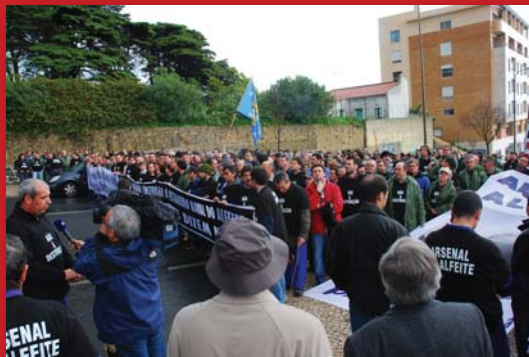
Manifestação no Ministério da Defesa, Fevereiro 2008, FS