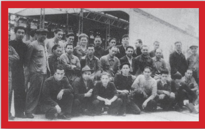
Operários traçadores navais do Arsenal do Alfeite, 1946. (Flores e Policarpo, 153)