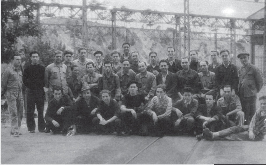
Grupo de Arsenalistas da Sala do Risco, (Serra, 52)

Quando o descontentamento crescia e o protesto se impunha, mesmo sob as leis militares, a palavra passava de oficina em oficina e em silêncio os arsenalistas concentravam-se frente à Administração. Era o "pisar a relva", expressão de luta e resistência protagonizada por gerações de operários até ao 25 de Abril.