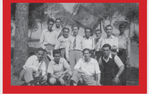
Confraternização de esperantistas do Arsenal. (Flores e Policarpo, 150)