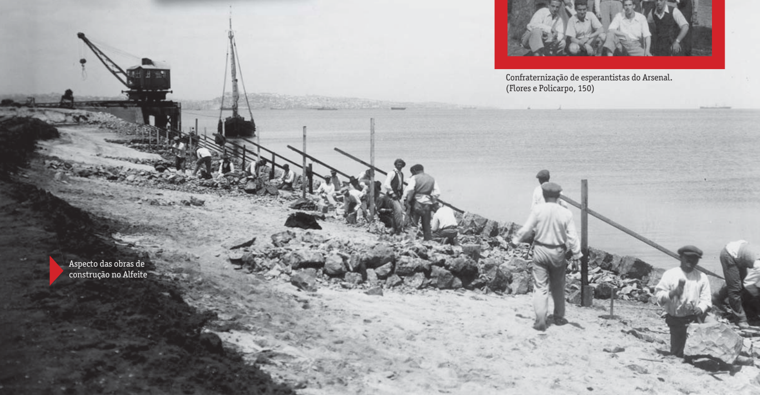
Aspecto das obras de construção no Alfeite