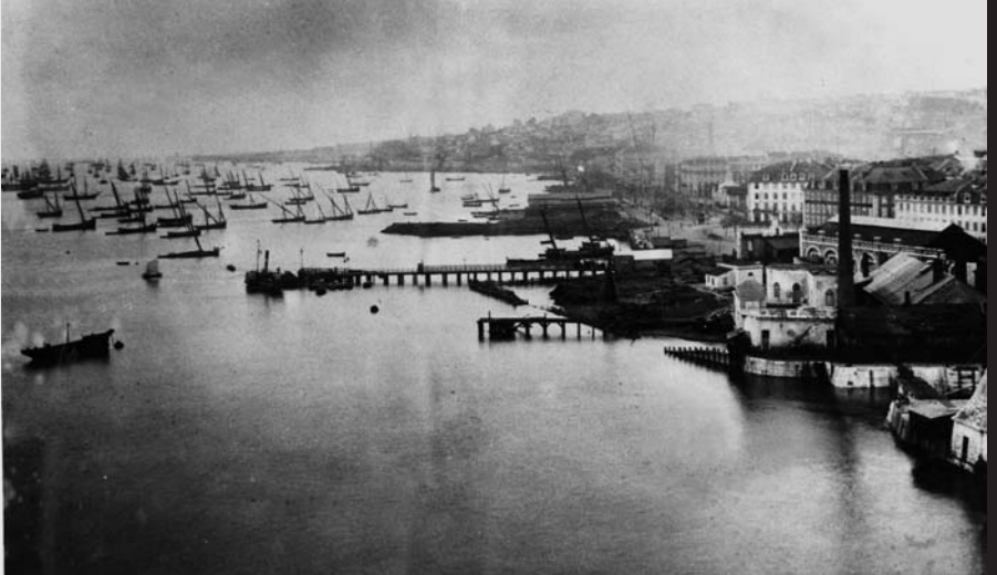
Arsenal da Marinha – extremo ocidental. 1839