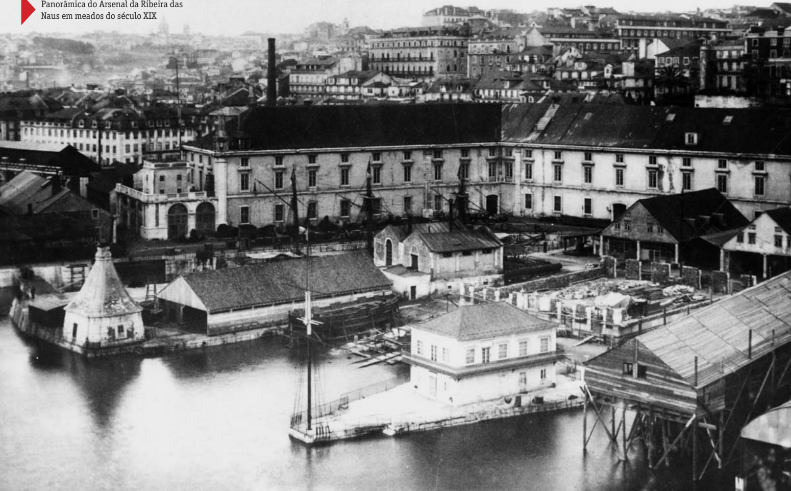
Panorâmica do Arsenal da Ribeira das Naus em meados do século XIX