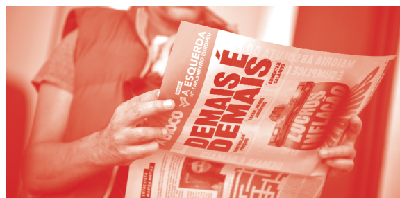
IMG.3 Ação contra a inflação nos produtos essenciais de supermercado

Queremos gerar receitas para financiar os serviços públicos e salários justos, através de impostos justos sobre as empresas digitais e as grandes fortunas . Este imposto aplica-se a fortunas acima dos 3.500 salários mínimos nacionais - cerca de três milhões de euros (deduzidos de dívidas), sendo aplicada uma taxa progressiva entre 1,7% e 3,5%. Vamos impor leques salariais nas grandes empresas para que um administrador não possa ganhar mais num mês do que um trabalhador num ano.