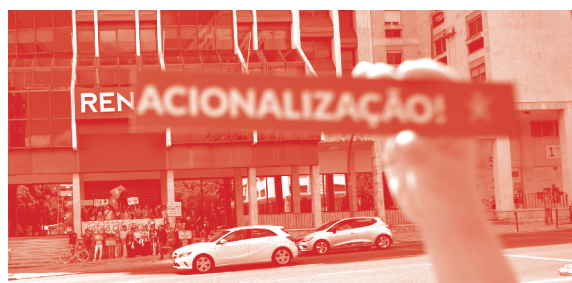
IMG.5 Ação à porta da sede da REN

Com a força do Bloco, a política não será uma porta para negócios da oligarquia.