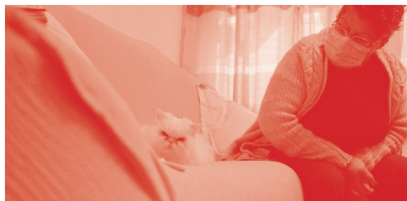
IMG.10 Visita a antiga ama da Segurança Social

Partilhamos a responsabilidade pelos nossos. O cuidado dos doentes, dos mais velhos e das crianças não pode ser um peso carregado apenas pelas famílias - em particular, pelas mulheres - ou um privilégio de quem tem dinheiro. Vamos criar o Serviço Nacional de Cuidados para proteger as crianças, para garantir independência e autonomia às pessoas com deficiência, para viver a velhice com qualidade de vida. Queremos serviços públicos atentos e próximos, independentemente da carteira de cada pessoa. Cuidarmo-nos e apoiar quem cuida é a nossa forma de vivermos juntos.