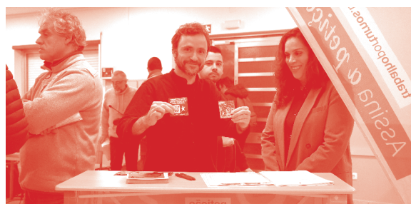
IMG.2 Sessão de conversa com trabalhadores por turnos

Vamos mudar a vida de quem trabalha por turnos e garantir regras para o seu descanso, nos fim-de-semana e entre turnos. Vamos reconhecer o desgaste de quem vive a vida do avesso, garantindo a antecipação da idade da reforma e a atribuição obrigatória de um subsídio por turnos de pelo menos 30% do salário.