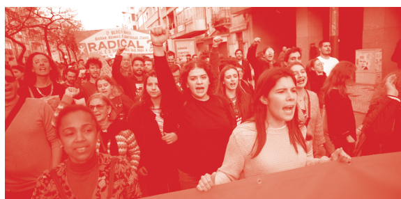
IMG.1 Manifestação Casa para Viver

Mudar de vida é ter uma casa decente e que o salário a possa pagar. Vamos estabelecer um teto nas rendas , ou seja, valores máximos de acordo com a localização e as características dos imóveis; parar a construção de hotéis; reduzir o alojamento local onde o turismo é excessivo; acabar com os vistos gold e construir casas públicas para baixar os preços. Essa nova política de habitação é o que o Bloco garantirá.