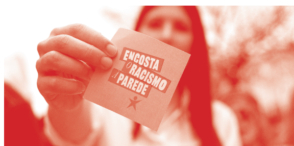
IMG.9 “Não nos encostem à parede”, contra a xenofobia e o racismo

A luta contra a xenofobia vai a par com a luta antirracista, a começar pela da juventude das periferias urbanas, onde a maior presença de população racializada motiva um discurso de criminalização das comunidades. Derrotar o racismo estrutural implica mudar políticas sociais, mudar leis, mudar discursos e narrativas que dominam em todas as áreas e enfrentar sem tibiezas a violência e o abuso policial.