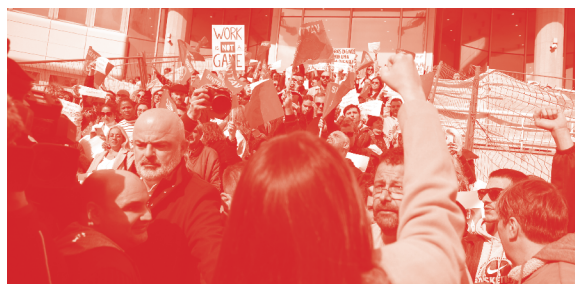
IMG.6 Mariana Mortágua na greve de trabalhadores da Teleperformance

Com a força do Bloco, o progresso será transformado em descanso, com a reforma completa aos 40 anos de descontos e com pensões dignas .