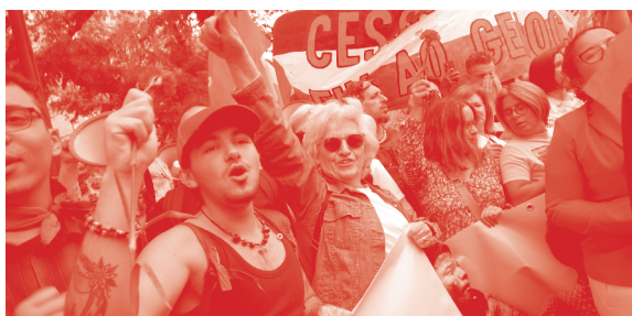
IMG.8 Marcha dos 50 anos do 25 de Abril

Com o Chega no parlamento e com a eleição de Trump, o ódio às mulheres e a pessoas LGBTQI+ tomou conta da agenda da direita. Para eles, liberdade é o poder de ofender e humilhar os outros. Para nós, liberdade é o direito a seres quem és . A tua liberdade depende da força do Bloco. Com o Bloco, o conservadorismo será vencido em nome do respeito: a nossa Constituição viva é o direito a amar quem se quiser, a viver em paz e segurança na rua e em casa. Lutamos pelos direitos das mulheres , pelo acesso ao aborto seguro e pela igualdade completa. Vamos garantir às pessoas com deficiência as condições para o seu reconhecimento e independência .