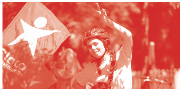
IMG.7 Roteiro pela justiça climática

Só há futuro se travarmos as alterações climáticas e nos protegemos dos seus efeitos. Com o Bloco, a transição ambiental será cumprida até 2030. Queremos reorganizar o setor energético, apostar na produção renovável descentralizada e recuperar o controle da infraestrutura energética, com a renacionalização das empresas privatizadas . Vamos mudar a forma como nos deslocamos, investir em transportes públicos gratuitos em todo o território, substituir viagens curtas de avião por comboio, reduzir o tempo e a poluição das deslocações para o trabalho, melhorar a circulação suave nas cidades, tornar o território e as infraestruturas mais resistentes às tempestades. Vamos reconverter produções poluentes, reflorestar o país em parceria com as comunidades locais, proteger o bem estar animal e a biodiversidade . Estamos ao lado das populações para travar a exploração extrativista, a agricultura intensiva e as indústrias poluentes que ameaçam o futuro da nossa terra. A transição ecológica é uma obrigação, mas também uma estratégia económica e social para a nossa casa comum.