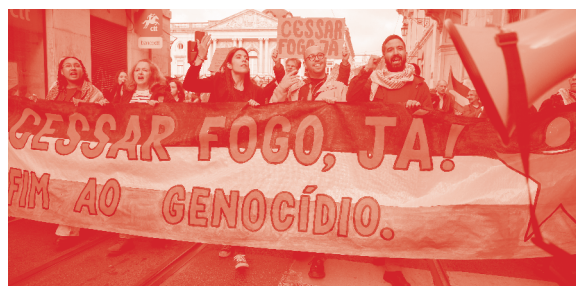
IMG.12 Marcha Nacional pela Palestina

A Europa e os EUA são cúmplices do genocídio em Gaza e nunca tentaram uma solução de paz na Ucrânia. Contribuíram para desvalorizar o direito internacional e permitiram que as Nações Unidas fossem enxovalhadas por países agressores, como Israel, Rússia ou EUA. O acordo que está a ser imposto à Ucrânia é apenas uma partilha dos seus recursos naturais entre Rússia e EUA, e são as fronteiras dessa partilha que a Europa se prepara para ir guardar com as suas tropas. O aumento da despesa militar é errado e não vai garantir a paz. A União Europeia tem os meios militares necessários para se defender, mas tem que organizá-los fora da NATO e da influência de Washington e tem que aceitar a soberania dos seus Estados. Em vez de cortes no Estado social para subsidiar a indústria militar norte-americana ou franco-alemã, queremos serviços públicos fortes que protejam as democracias do crescimento do autoritarismo. Não há maior ameaça à segurança da Europa do que deixar cair os nossos países nas mãos da extrema-direita. Não queremos a bomba nuclear francesa nas mãos de Le Pen. Vamos reconhecer o Estado da Palestina, defender a autodeterminação do Saara Ocidental , apoiar o direito internacional e proteger a democracia. É essa a força da paz.